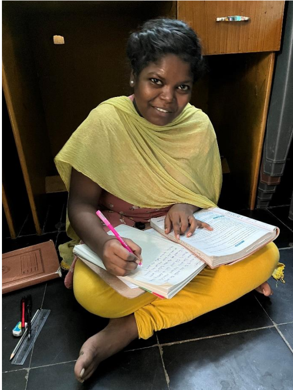
Danalaxmie is aan het voorbereiden voor haar examens.