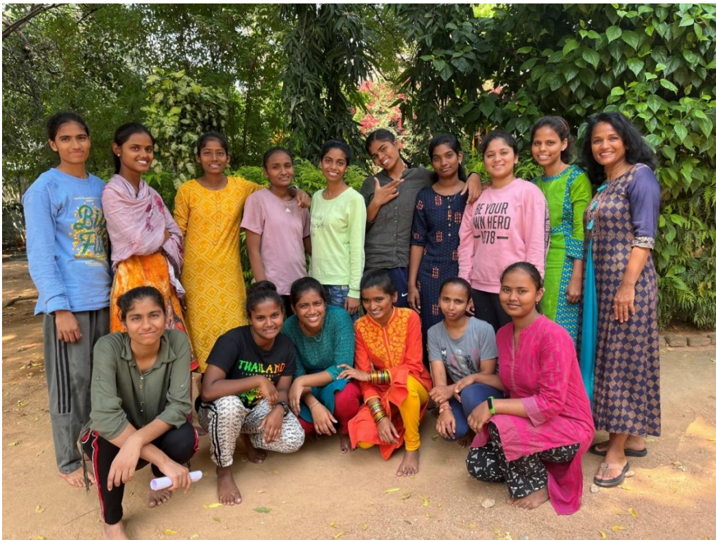
Meisjes uit het RKH die Stichting Manasu sponsort in het onderwijs.

Stichting Manasu Postadres Bijvoetplan 12