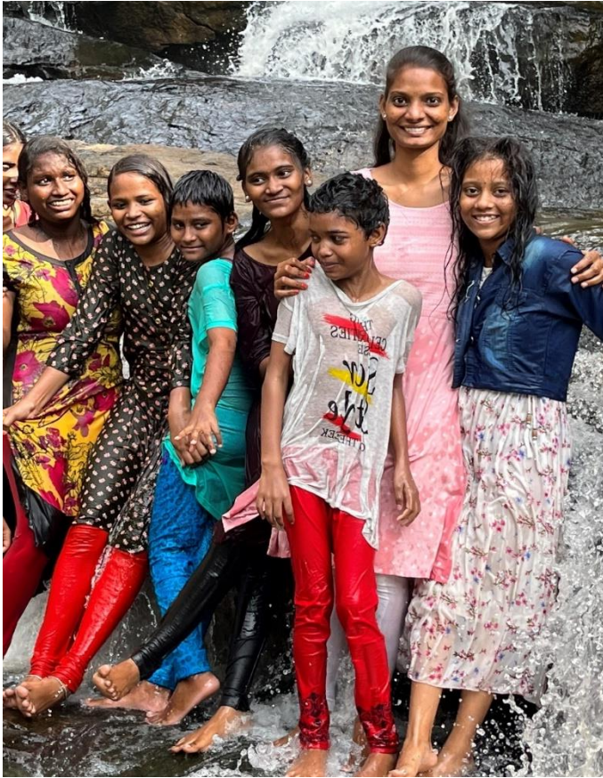
Uitje naar de watervallen, wel 9 uur rijden voor 1,5 uur waterpret. Het was het allemaal waard.