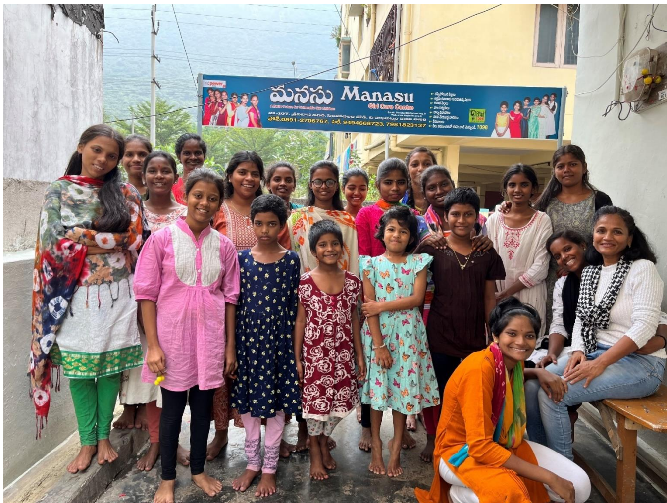
Meisjes uit Manasu Girl Care Center

De kinderen en het bestuur van Manasu wensen u een mooi en gezond 2024. Gelukkig Nieuwjaar!