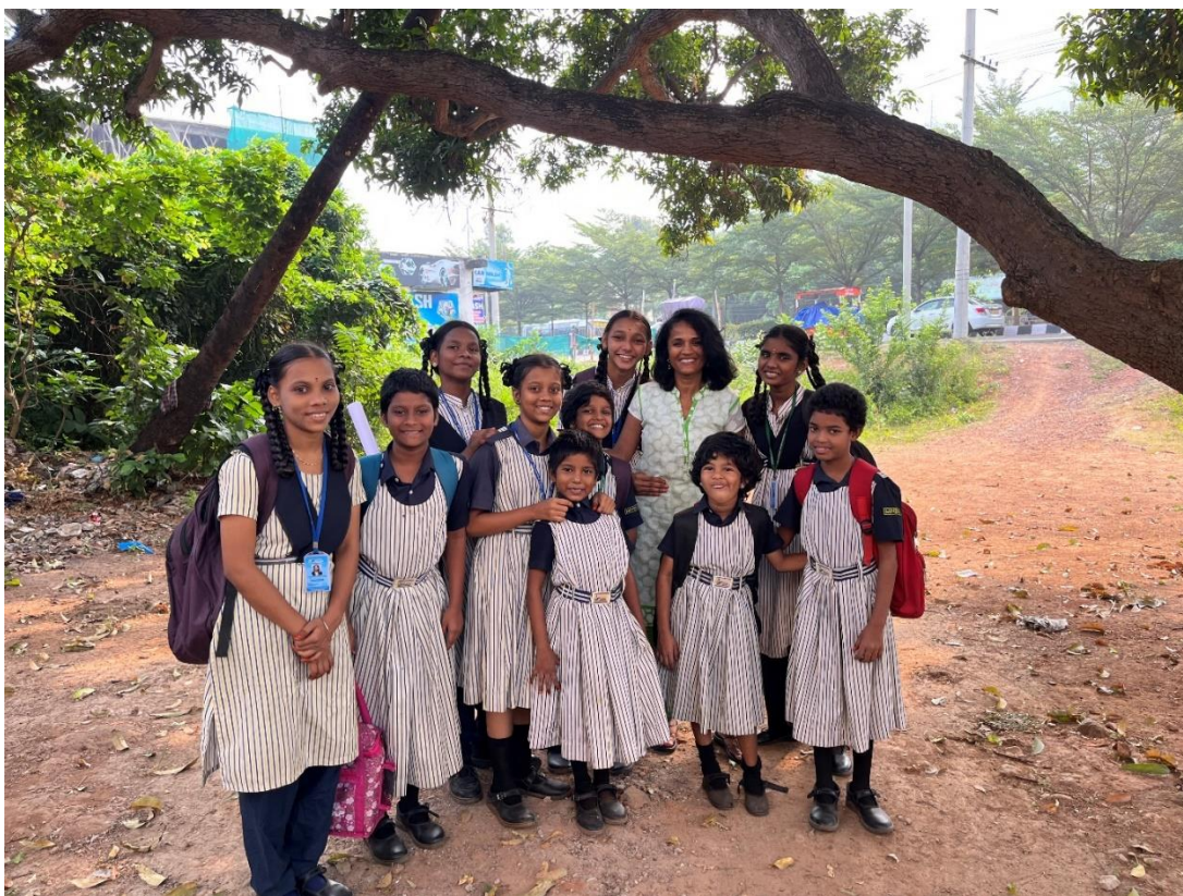
Meisjes van MGCC van de Minerva school