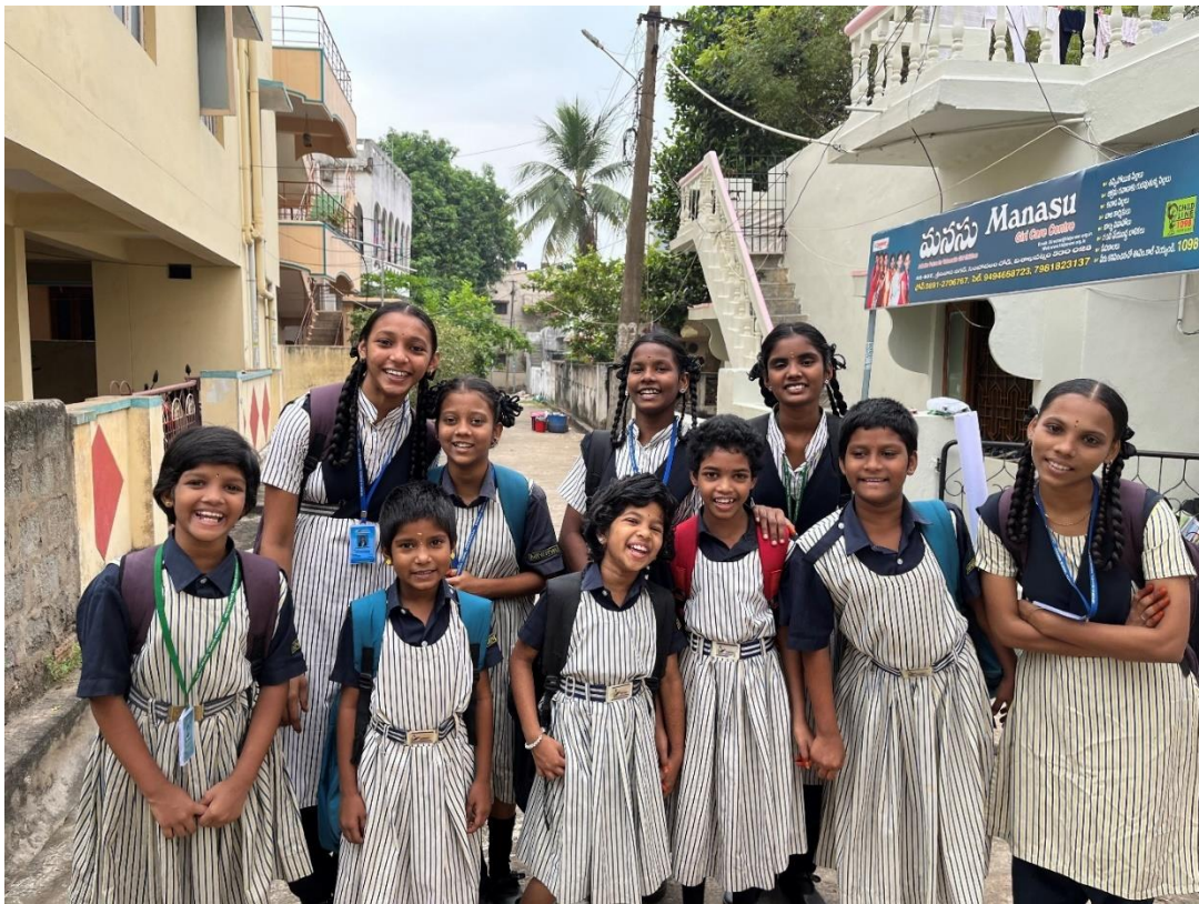
De vakantie is voorbij, de meisjes zijn blij dat zij weer naar school kunnen gaan.