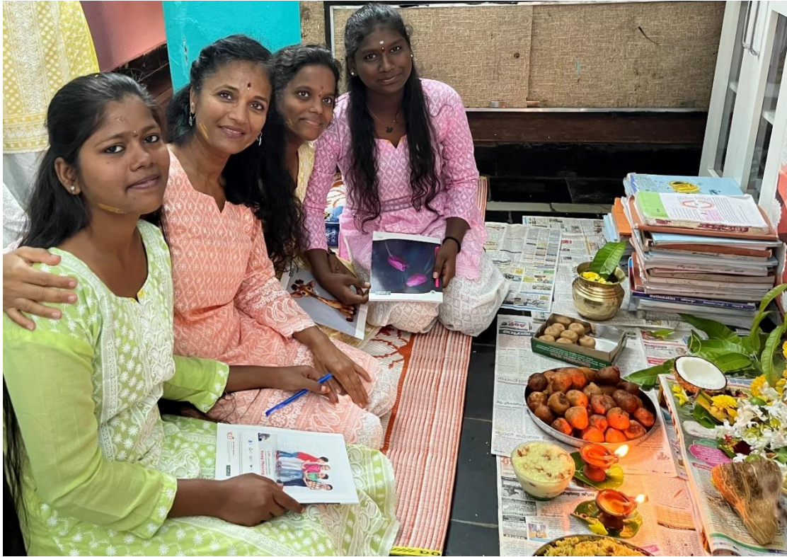
Dussehra festival; het goede overwint het kwade. Ook ontvang je zegeningen voor je studie.