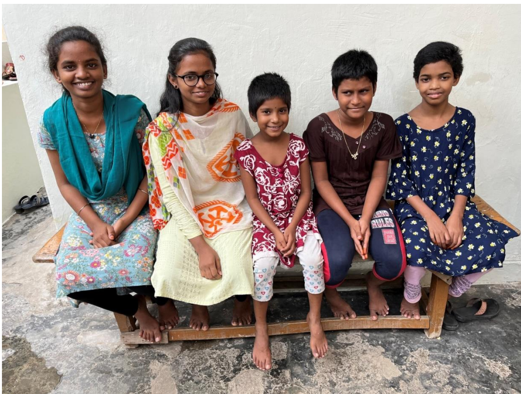
Nieuwe meisjes die vanaf 2023 in MGCC wonen.