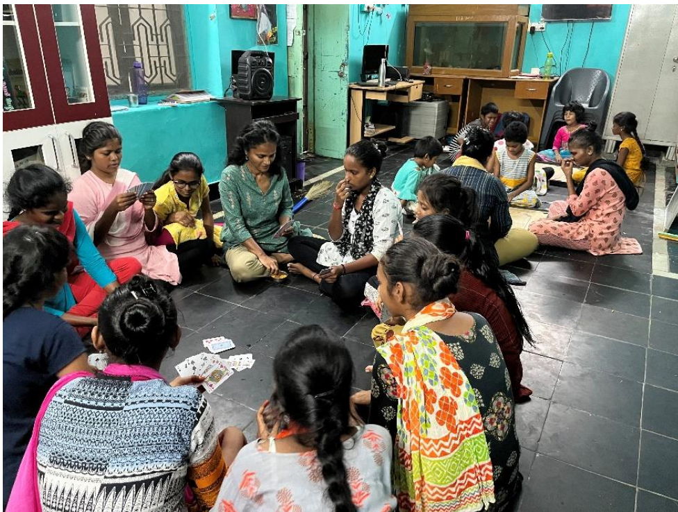
MGCC, de meisjes het kaartspel "ezelen" geleerd.