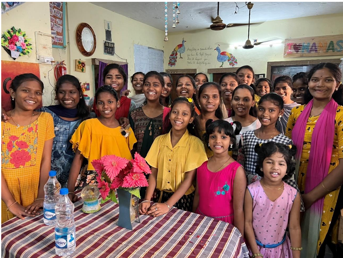
Kinderen uit MGCC