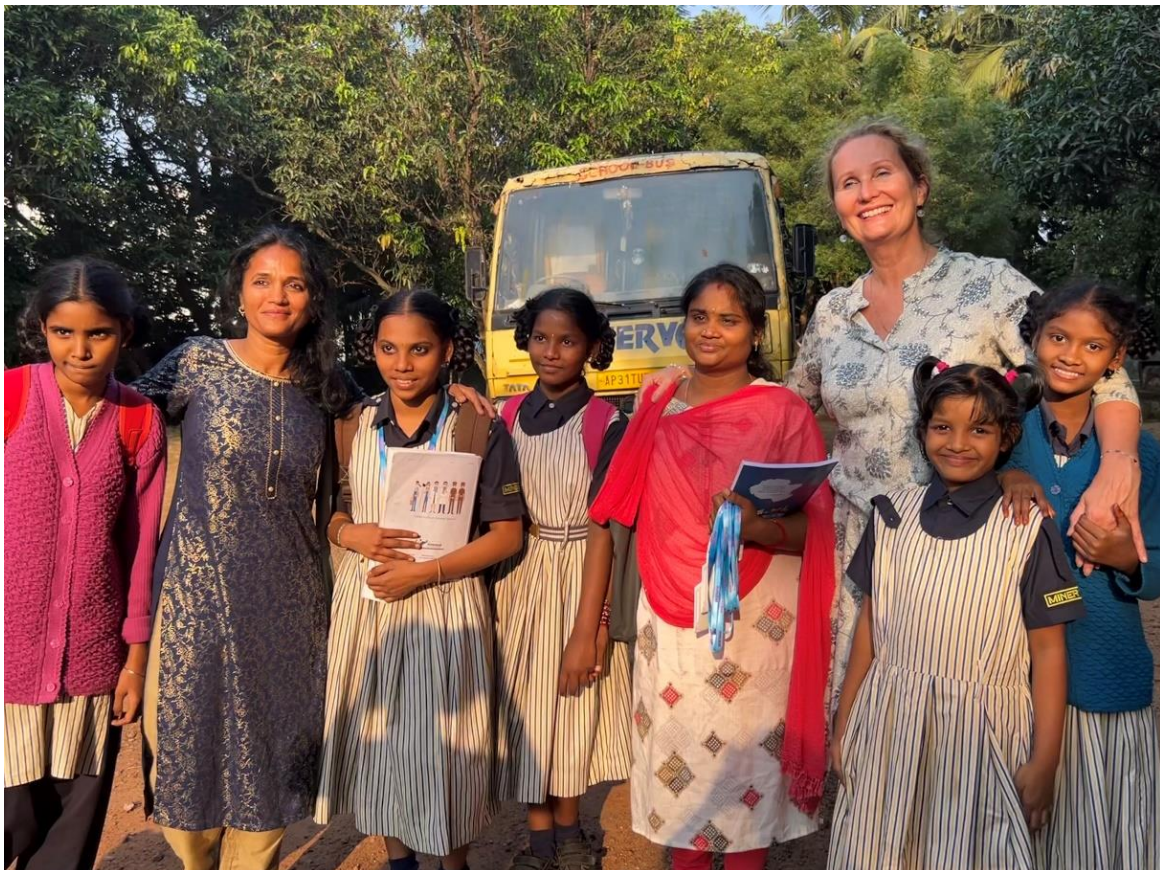
Een bezoek gebracht aan de school van kinderen uit Manasu Girl Care Center.