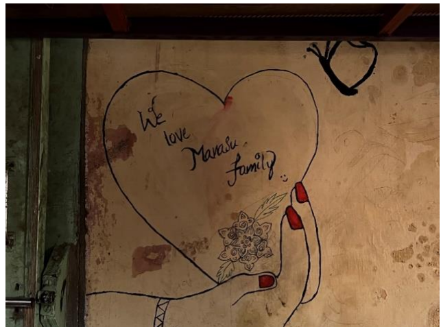
We love Manasu Family