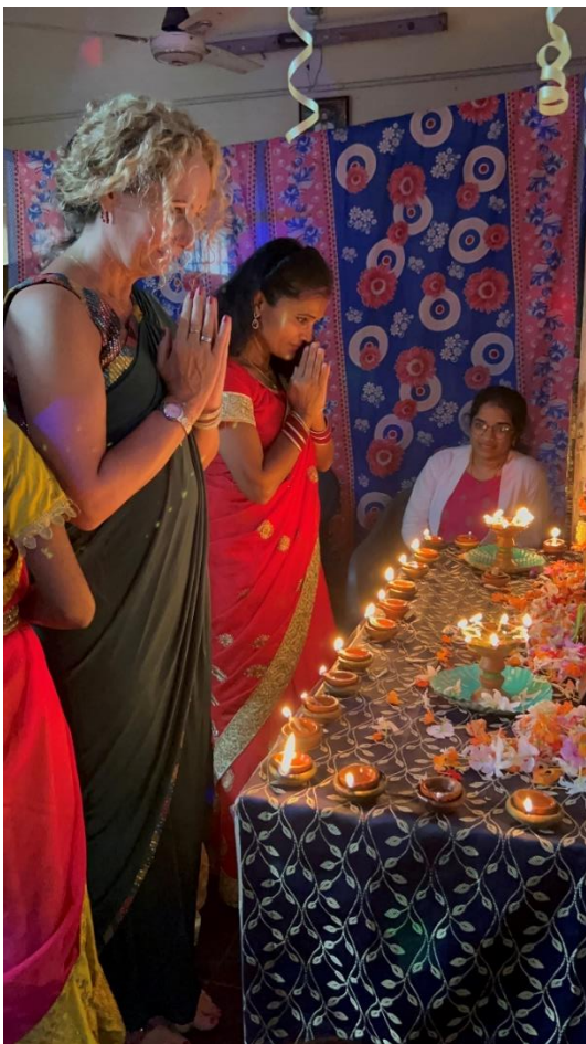
Dank voor uw steun en het vertrouwen!