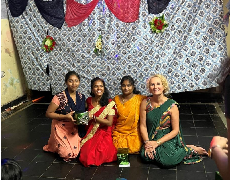
Culturele middag in MGCC