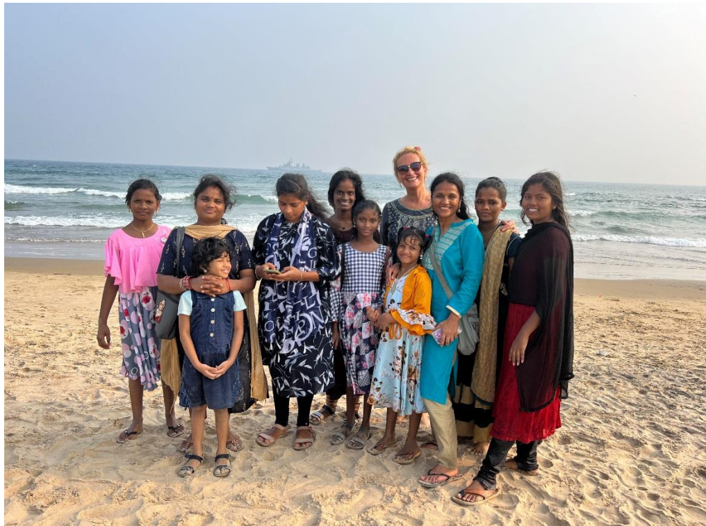
Na twee jaar zijn de meisjes uit MGCC op het strand. Zij hebben zo genoten.