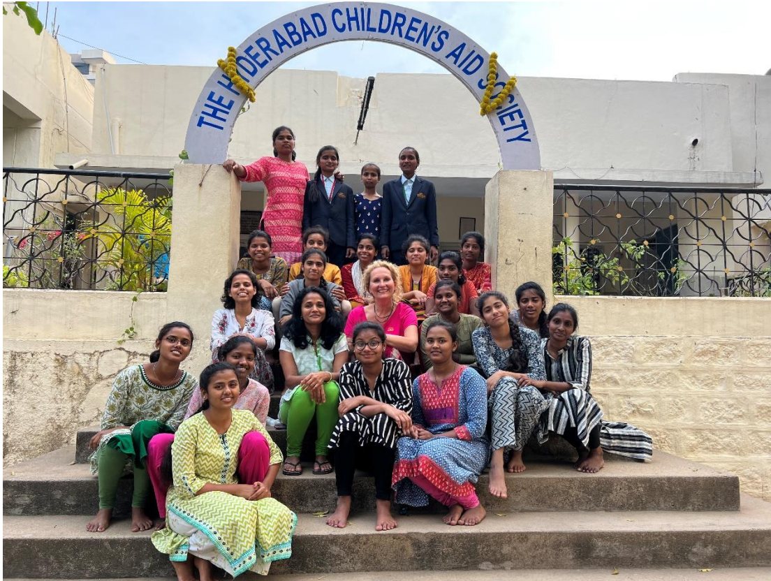
21 meisjes die door Stichting Manasu worden gesponsord.

Ik stel u enkele kinderen voor die met uw donatie onderwijs volgen: