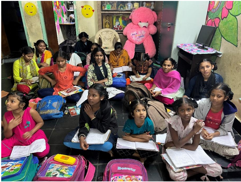
Manasu Girl Care Center, na school huiswerk maken