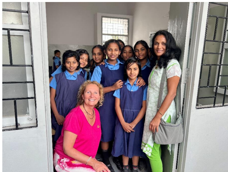
School in RKH