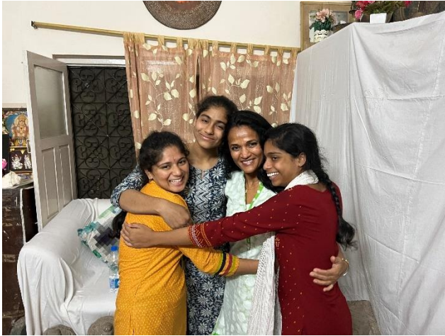
Kinderen uit RKH